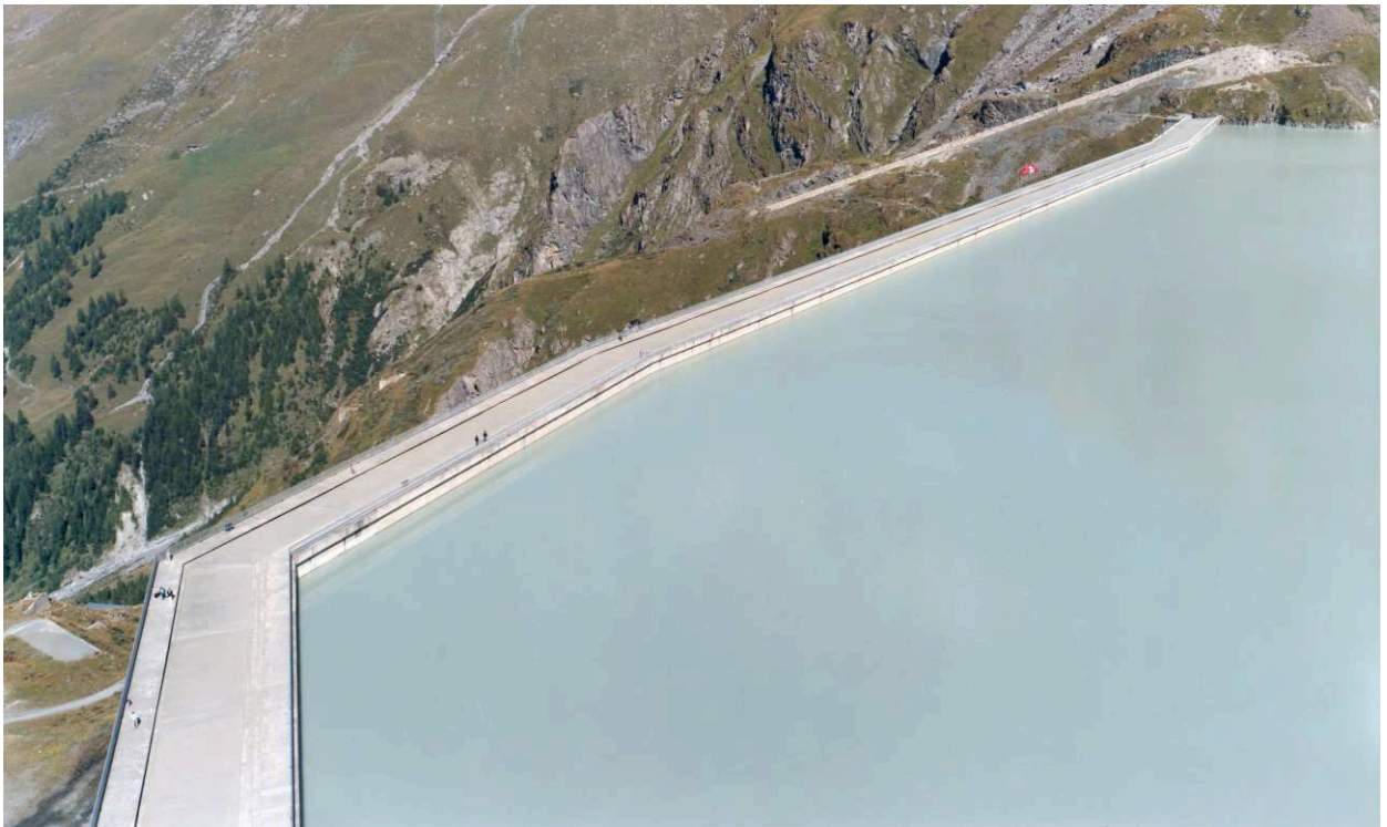
Boris Becker, Lac de Dixence , 2003 © Boris Becker