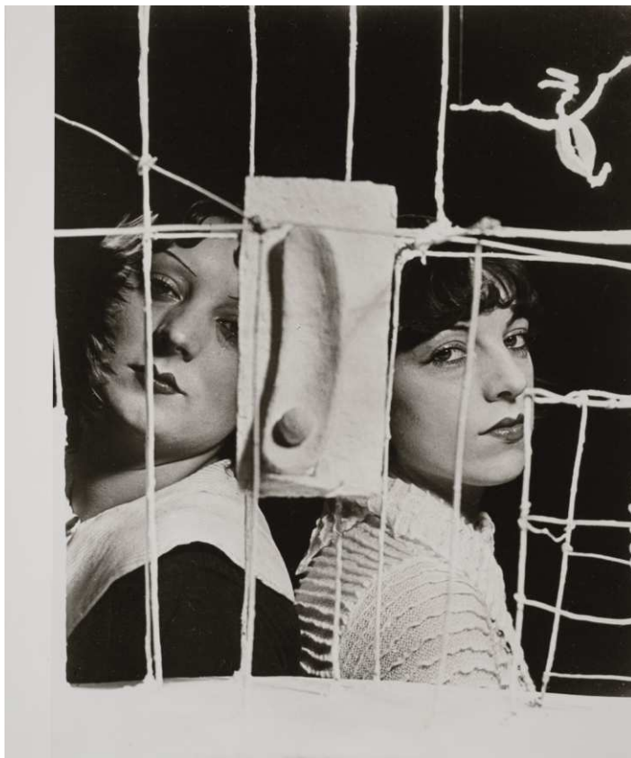
Man Ray, Palais de quatre heures , 1932-33/1991 © ADAGP Man Ray Trust