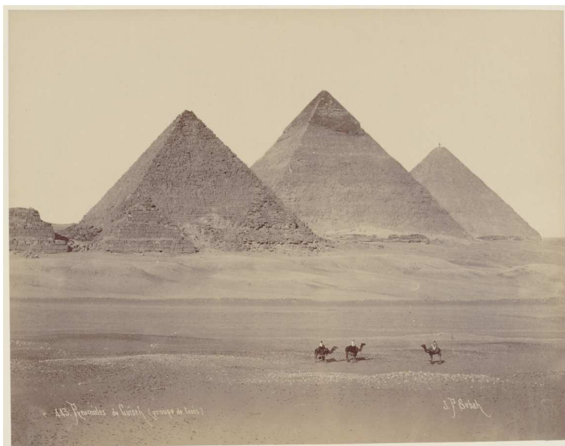
J. Pascal Sébah, Blick von Süden auf die Pyramiden von Gizeh , um 1890 © Sammlung Museum für Photographie Braunschweig / Depositum Stadtarchiv Braunschweig