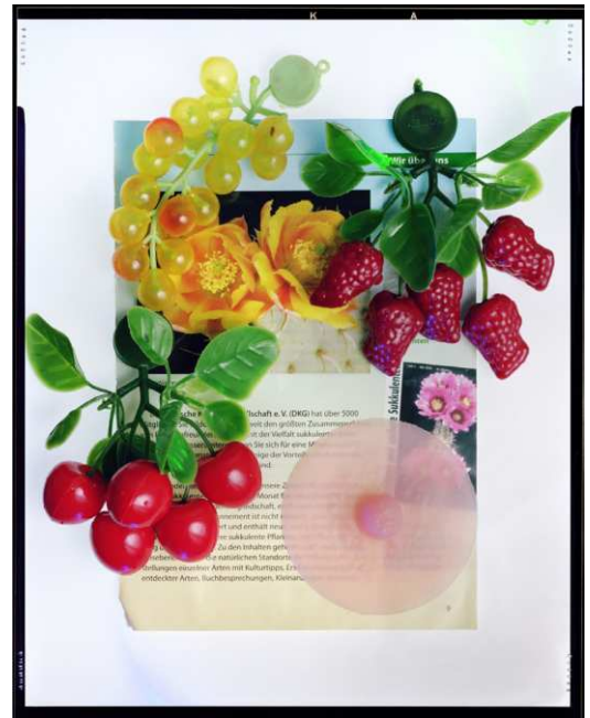
Ketuta Alexi-Meskhishvili, Appetite , 2021 © Ketuta Alexi-Meskhishvili