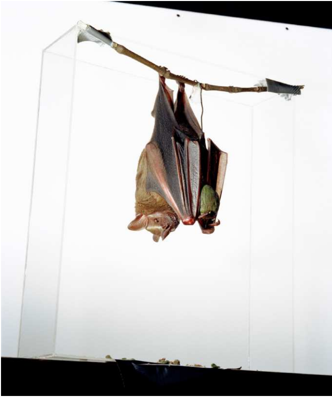
Sanna Kannisto, Artibeus lituratus , 2000