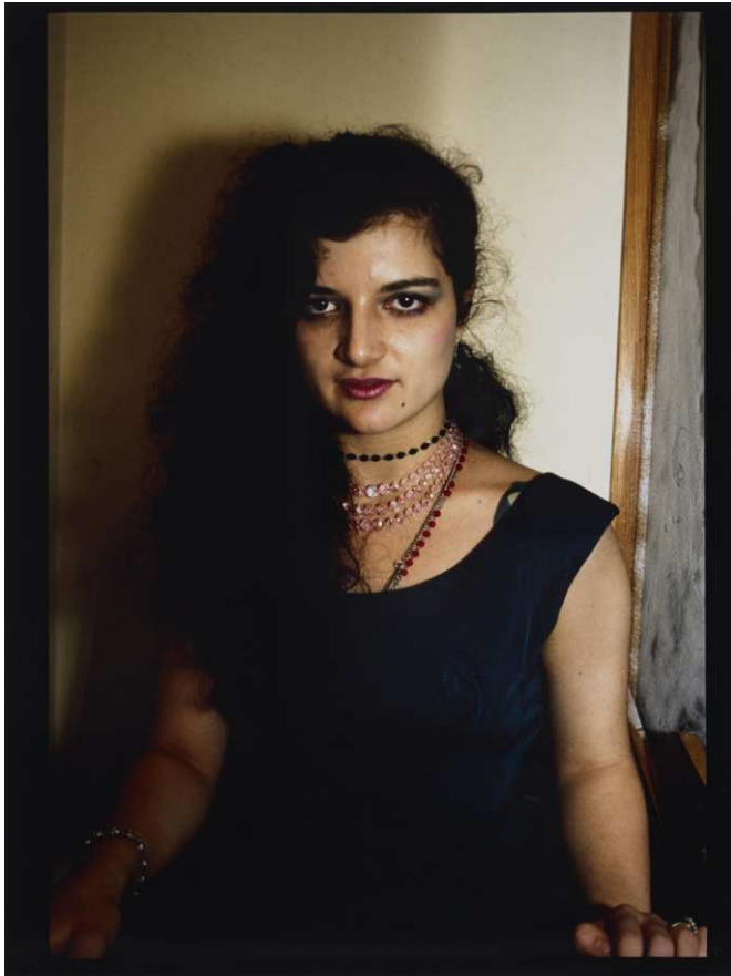
Nan Goldin, Lynelle in Japanese restaurant , New York City, 1988/1996 © Nan Goldin