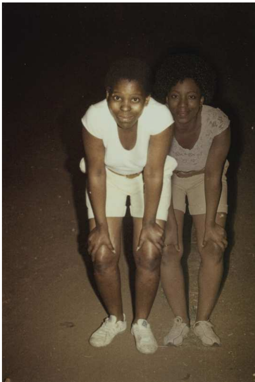
Lebohang Kganye, Ke tsamaya masiu II , aus der Serie Ke Lefa Laka/Her-story , 2013/2021 © Lebohang Kganye