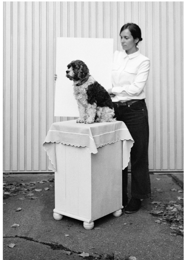
Christian Retschlag, Henry , 2019 © Christian Retschlag

Bereits Ende der 1980er Jahre konnte ein wichtiges Konvolut von Fotografien aus der Frühzeit des Mediums aus dem 19. und frühen 20. Jahrhundert angekauft werden.