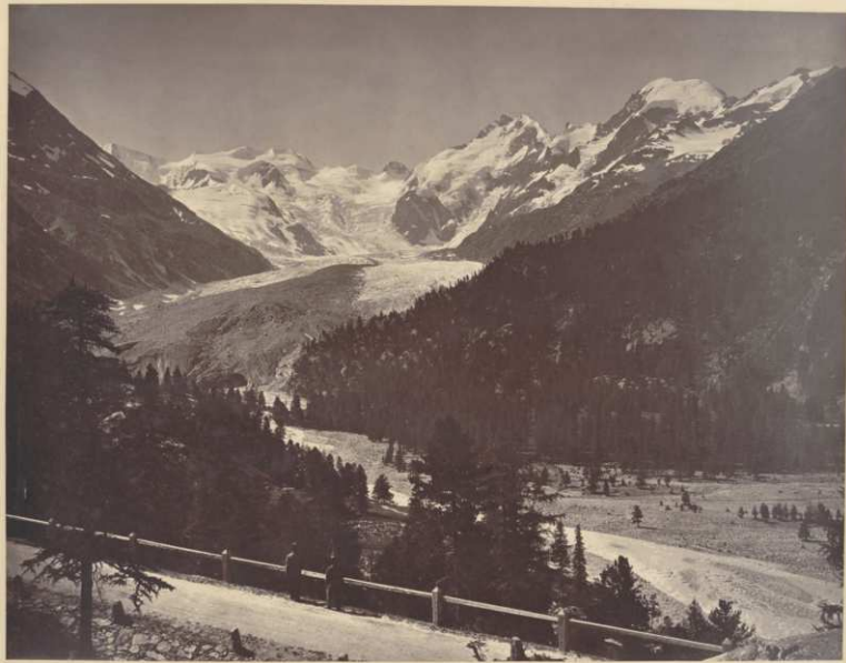
Adolphe Braun, Der Morteratsch Gletscher mit der Straße zum Bernina Pass nach Italien , um 1870 © Sammlung Museum für Photographie Braunschweig / Depositum Stadtarchiv Braunschweig