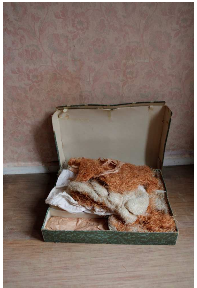
Eva-Maria Tornette, aus der Serie Tapeten Hossfeld , 2022

Zu einem wichtigen Bestandteil der partizipativen Möglichkeiten der Mitglieder an der Ausstellungsgeschichte des Museums gehörten und gehören die Mitgliederausstellungen – eine Tradition, die mit unterschiedlichen inhaltlichen Konzepten am Ende eines jeden Ausstellungsjahres bis heute gepflegt wird.