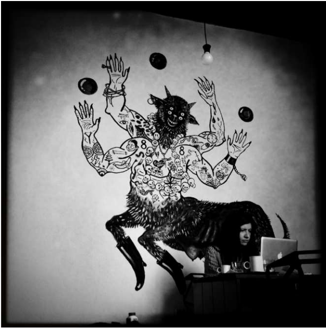
Walter Ackers, Entfesselt , 2012 © Walter Ackers