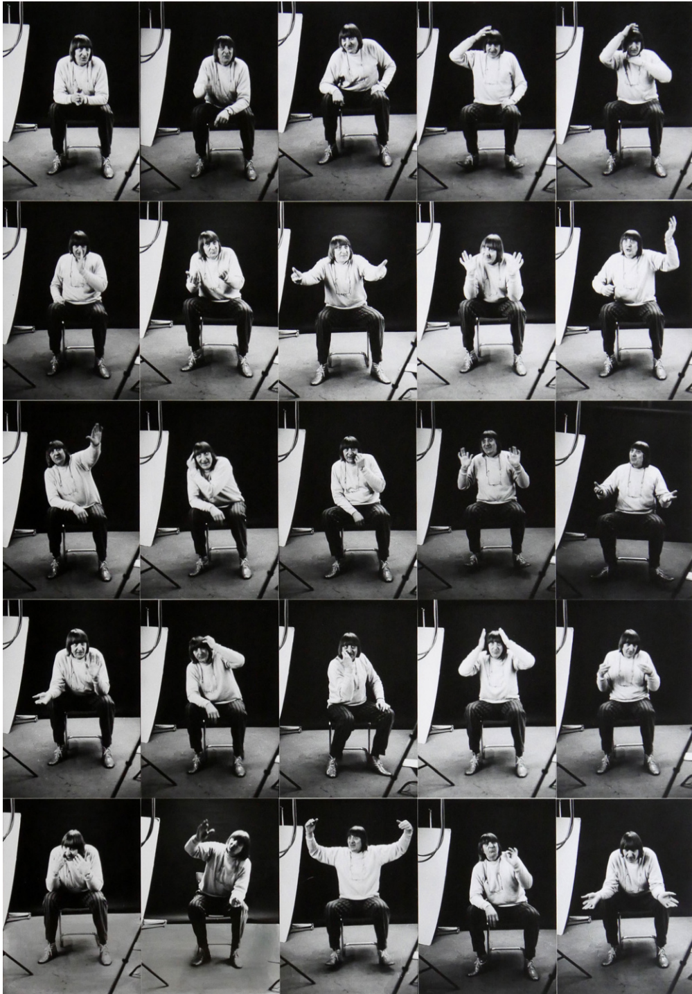
Michael Ewen, Walter Schels erläutert das „Offene Geheimnis“, 1995