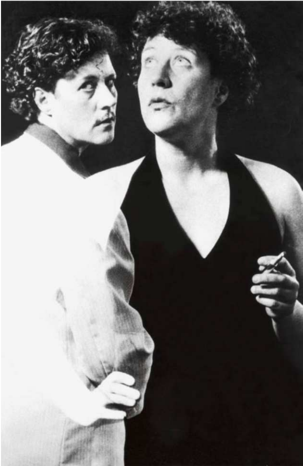
Iris R. Selke, Maria e Luigi # 1 , 2002 © Iris R. Selke