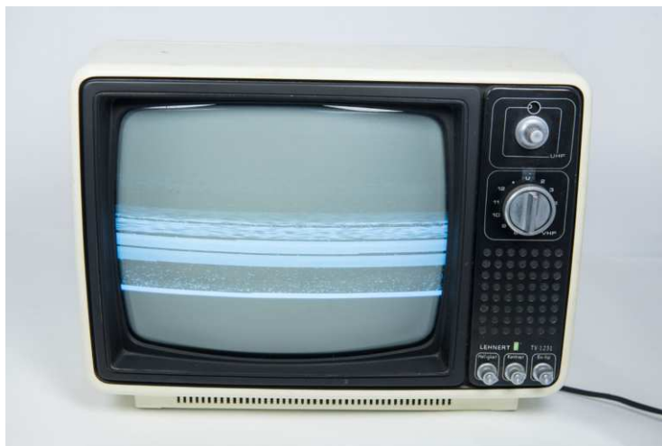
Ulf Jasmer, Detail , aus der Serie Dinge 1984 versus 2024 , 2024 © Ulf Jasmer