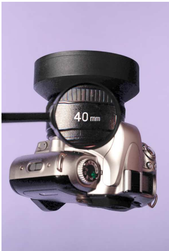
Helge H. Paulsen, Die 40 unter die Lupe nehmen , o.J. © Helge H. Paulsen