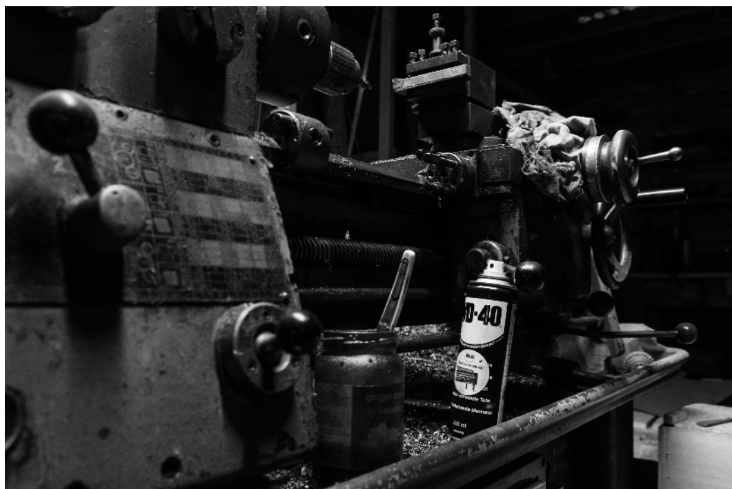
Renate Fink, aus der Serie Wasserverdrängung , o.J.